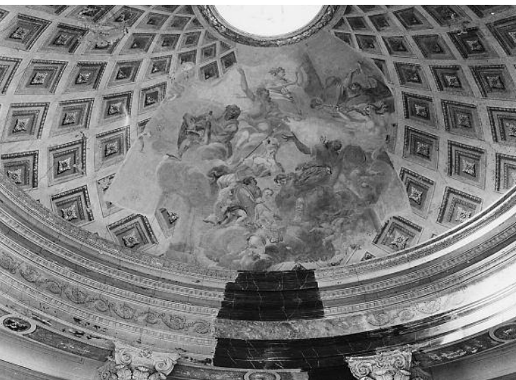
Freigelegter Ausschnitt der 1829 aufgetragenen Übermalung in der Kuppel der Rotunde während der Restaurierung 1973

Mit einem Konzert in der Rotunde ab 18:30 Uhr bedanken wir uns bei allen, die zum Gelingen des Tages des offenen Denkmals 2017 in Hessen beigetragen haben. Weitere Informationen unter https://lfd.hessen.de/service/tag-des-offenen-denkmals