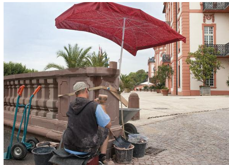
Steinmetzarbeiten an der Balustrade vor dem Biebricher Schloss, Foto: Chistine Krienke, Landesamt für Denkmalpflege Hessen

Musikalische Begleitung durch Andreas Hertel, Jazzpianist und Komponist, Wiesbaden