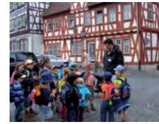
STADTRUNDGÄNGE PFÄLZER SCHLOSS, RITTERSAAL

1275 Jahre Groß-Umstadt Die Erhaltung eines städtischen Denkmalensembles